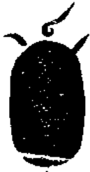
秘字蓋了再以 三筆向上掃出 如金光燦然

書成於中間書元吉喜勅召黑虎大神劉 文顯容念前召咒存天門有一乾卦三以 心火自頂門而出衝開想見一整字即吸 入口中以舌尖書錄九徧結成金團閉炁 作咄字音存元帥及黑虎呵入符中仍念 召咒塗畢却書玄帝祕諱蓋之