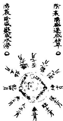
陰陽交感日月別錄