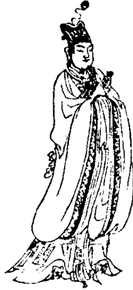
第七下玄玄母君叔火王字右迴光絳服