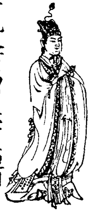
第六上玄元父君高同生字左迴明燄蓋服